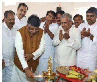
Le Ministre de l'Union, Śrī Ravi Shankar Prasad, inaugurant le 'Sri Sathya Sai Nithya Anna Seva'

Le programme de la matinée dans le Sai Kulwant Hall s'est ensuite achevé par des bhajan et l' ārati . Puis le Ministre de l'Union, Śrī Ravi Shankar Prasad et d'autres dignitaires, ont inauguré le Sri Sathya Sai Nithya Anna Seva , projet destiné à fournir quotidiennement, dans les locaux de l'ashram, des repas indiens sains et gratuits à tous les fidèles visitant Praśān̄thi Nilayam.