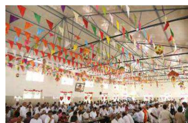
Sri Sathya Sai Nithya Anna Seva

Le programme de la matinée dans le Sai Kulwant Hall s'est ensuite achevé par des bhajan et l' ārati . Puis le Ministre de l'Union, Śrī Ravi Shankar Prasad et d'autres dignitaires, ont inauguré le Sri Sathya Sai Nithya Anna Seva , projet destiné à fournir quotidiennement, dans les locaux de l'ashram, des repas indiens sains et gratuits à tous les fidèles visitant Praśān̄thi Nilayam.