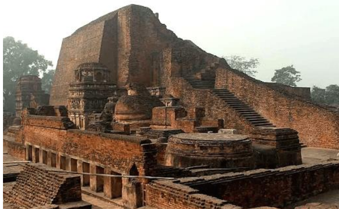
Ruines de l'Université de Nālandā qui a été fondée au début du V e siècle, dans l'actuel Bihar, et qui a prospéré pendant 600 ans jusqu'au XII e siècle.

Même au temps des vastes universités comme Nālandā, Vikramaśīla, Valabhi, etc., au début de l'ère chrétienne, l'éducation était totalement gratuite. Durant sa visite en Inde (629-645 av. J.-C.), lorsque Hiuen Tsang est demeuré à l'université de Nālandā pendant 5 ans, l'université comptait environ 10 000 enseignants et étudiants, certains étudiants venant du Japon, de Corée, du Tibet, du Népal et de Chine. En plus de l'éducation gratuite, les étudiants recevaient des vêtements gratuits et étaient nourris, logés et soignés gratuitement. Comme le dit Bhagavān, Bhārat a été l'enseignant du monde depuis des temps anciens.